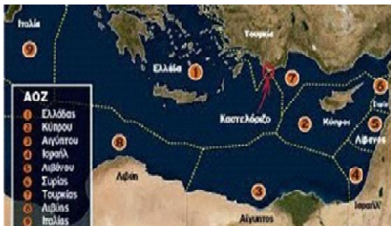
ΧΑΡΤΗΣ 2: Απεικονίζει την ΑΠΟΚΛΕΙΣΤΙΚΗ ΟΙΚΟΝΟΜΙΚΗ ΖΩΝΗ (ΑΟΖ) ΤΗΣ ΚΥΠΡΟΥ και της ΕΛΛΑΔΑΣ.

Ο ακόλουθος χάρτης δείχνει ξεκάθαρα την οριοθέτηση της ΑΟΖ των χωρών της Μεσογείου θάλασσας με βάση το