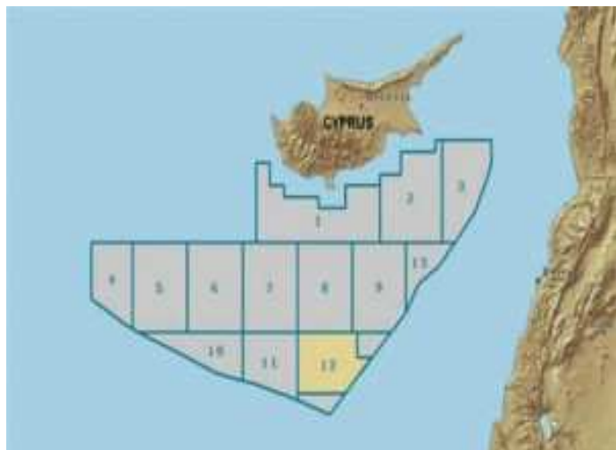
ΧΑΡΤΗΣ 3: ΚΥΠΡΙΑΚΗ (ΑΟΖ) – ΟΙΚΟΠΕΔΟ 12

δικαίωμα, το οποίο αναφέρεται στη δικαιοδοσία του παράκτιου κράτους μέχρι και κάτω από την επιφάνεια της θάλασσας. Η επιφάνεια είναι διεθνή ύδατα.